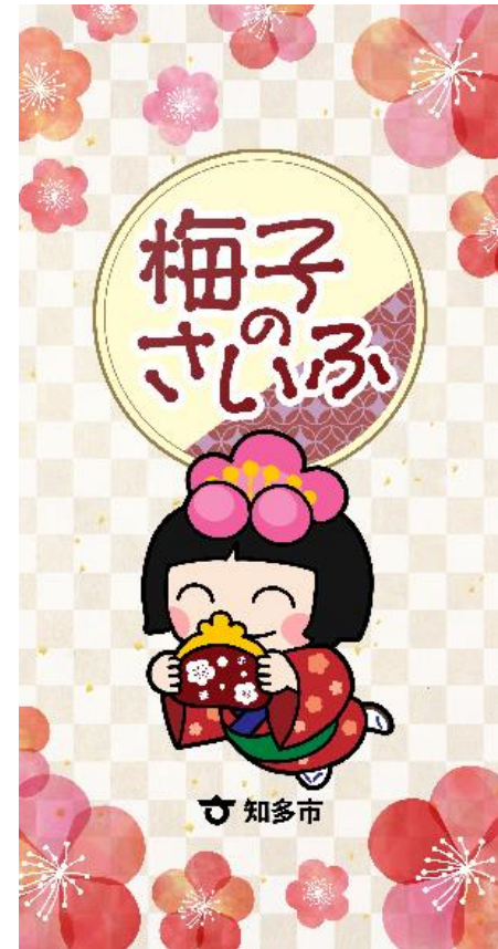
▲ 専用アプリ「梅子のさいふ」