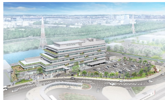
▲新庁舎のイメージ図