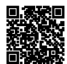
▲実施計画・主要事業