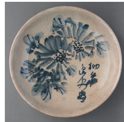
▲久野柳荘《平皿》制作年不明 (歴史民俗博物館蔵)