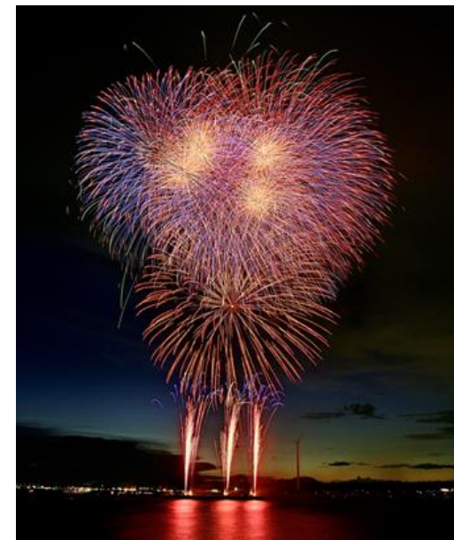
▲昨年の花火大会の様子