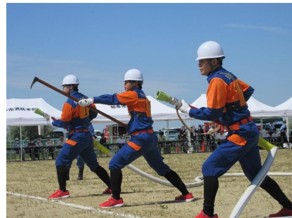
▲前回(令和5年度)の様子

知多市消防団は、愛知県消防操法大会で平成25年から27年まで3年連続優勝、令和4年度に優勝を果たし全国大会に出場するなど優秀な成績を収めており、レベルの高い操法をご覧ください。