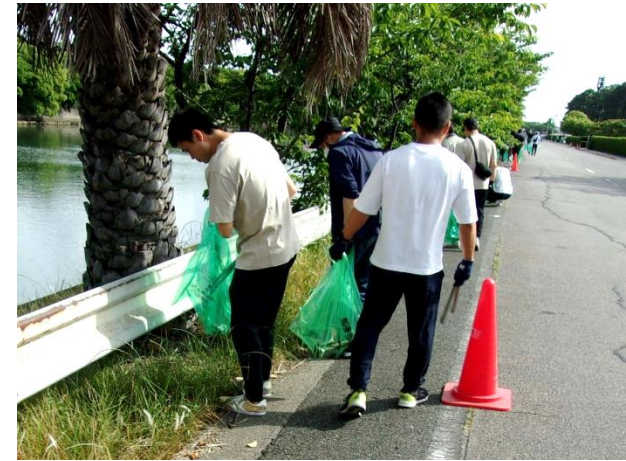
▲クリーンキャンペーンの様子

自分たちのまちは自分たちの手できれいにしようと平成12年に始まったクリーンキャンペーンは、今年で25回目となります。大人から子どもまで全市民が一斉に家の周りや道路、公園、公共施設周辺などを清掃するキャンペーンです。同日には、臨海部企業の方々や、知多市建設業協力会、知多市職員互助会も清掃活動を行います。