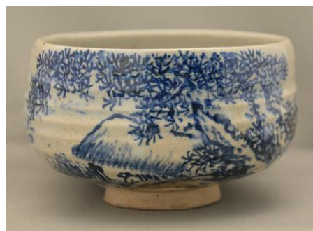
▲山本石荘《犬山焼 茶碗》制作年不明 (歴史民俗博物館蔵)

日時 5月25日(土)～7月15日(祝・月) 午前9時～午後5時(入館は午後4時30分まで)