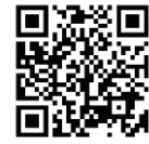
子育て総合支援センター (ぽぽらす)