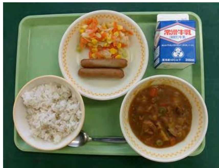
▲提供されている学校給食の例