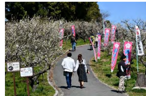
▲佐布里池梅まつりの様子