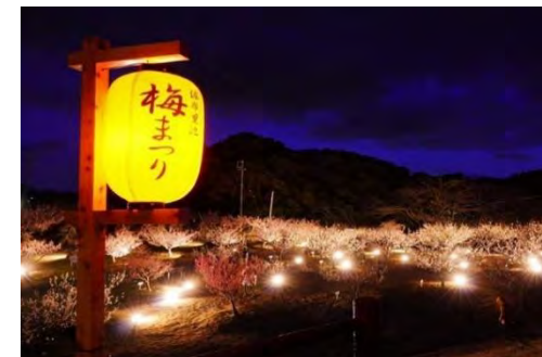
▲梅林ライトアップ