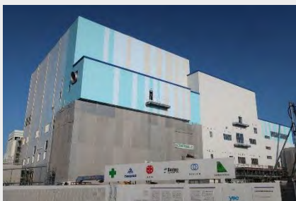
建設中の西知多クリーンセンター▶