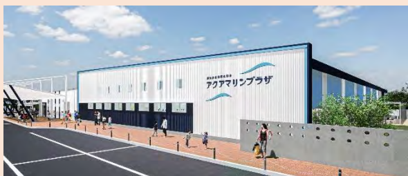
▲アクアマリンプラザ外観イメージ