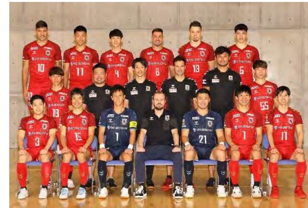
▲名古屋オーシャンズ