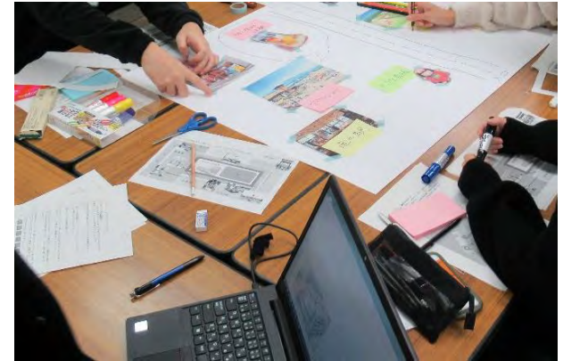
▲過去の市民会議の様子