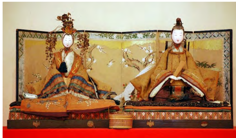
▲親王飾り（江戸時代後期）

日 時 1月20日（土）～3月10日（日）の午前9時～午後5時。入館は午後4時30分まで 月曜休館。ただし、2月12日（休・月）は開館、13日（火）は休館