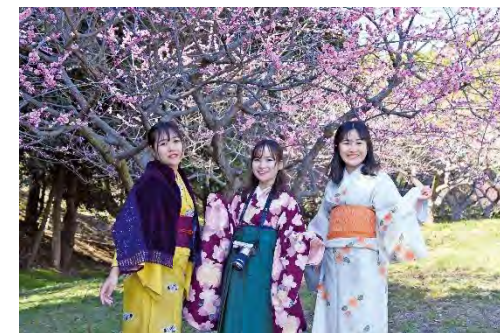
▲#ソウリデキモノ イメージ