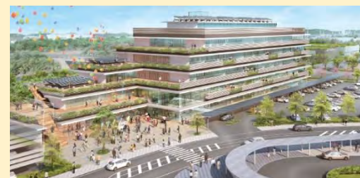
新庁舎のイメージ▶