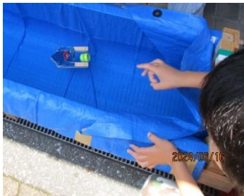
◀ ゴム動力ボード (基礎)