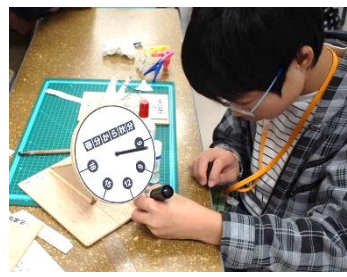
◀ 時計 (応用)