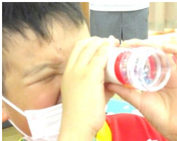
◀ 万華鏡 (基礎)