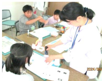
◀ 光と色の実験 (応用)