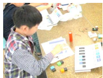
◀ プログラミング (基礎・応用)