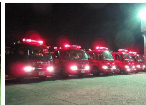
▲昨年の出発式の様子