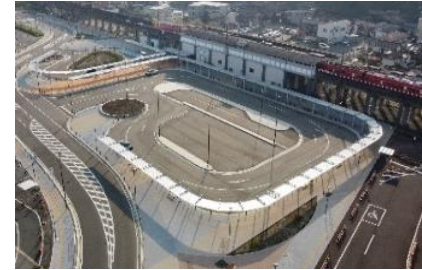
▲朝倉駅前ロータリー

朝倉駅周辺整備事業で2年度に着工した駅前ロータリーが完成し、全面的に利用を開始しました。