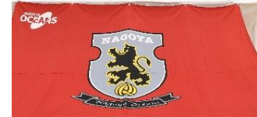
▲名古屋オーシャンズ（株）と包括協定締結式の様子