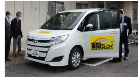
▲東部コミュニティの地域バス

既存の交通で賄うことができない移動ニーズに対応するため、実証運行を行っていた「地域バス」を本運行に移行しました。