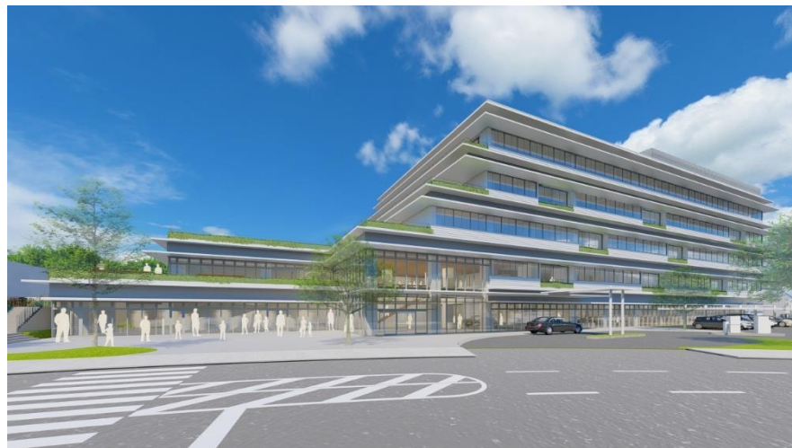
▲ 新庁舎のイメージパース（規模：地上5階建、延床面積：約10,730㎡）