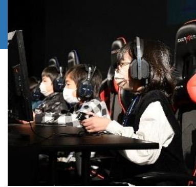
▲eスポーツ大会の様子

知多市で初めてのeスポーツ大会を開催し、市内外からおよそ50人が参加。参加者が優勝を目指して、落ち物パズルゲーム「ぷよぷよeスポーツ」で対戦しました。