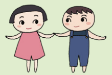
つなガール・さきエール

話をよく聞き、一緒に考えてくれるゲートキーパーがいることは、悩んでいる人の孤立を防ぎ、安心を与えます。