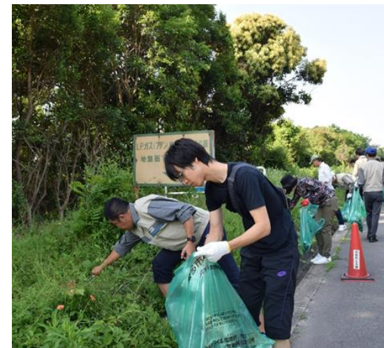
▲クリーンキャンペーンの様子

クリーンキャンペーンは、全市民が一斉に家の周りや道路、公園、公共施設周辺などを清掃するキャンペーンで、今年で24回目となります。臨海部企業の方々や、知多市建設業協力会、知多市職員互助会も参加します。