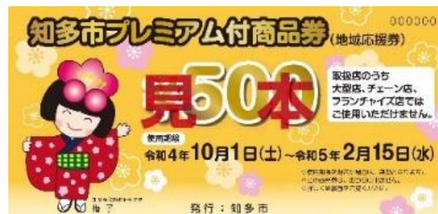
▲ 令和4年度プレミアム付商品券