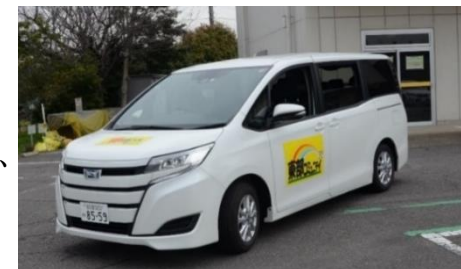
▲ 東部コミュニティの地域バス

※ 3か月連続で目標値を下回り、かつ利用促進策を講じても改善が見込まれない場合は、本運行を中止します。