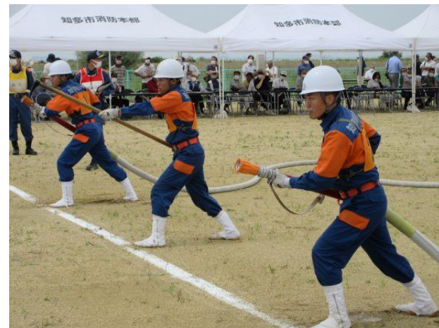
▲前回(令和4年度)の様子

知多市消防団は、令和4年度愛知県消防操法大会のポンプ車操法の部で優勝し、全国大会に出場するなど優秀な成績を収めており、レベルの高い操法をご覧いただけます。