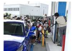
水素ステーション 見学会の様子