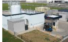
認証プロジェクト例 セントレア貨物地区 水素充填所