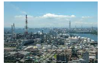
四日市コンビナート