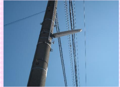
【電柱に設置されている防犯灯】

防犯灯が明るく灯る、安全・安心な生活環境は、地域住民の助け合いによって成り立っているんだね。