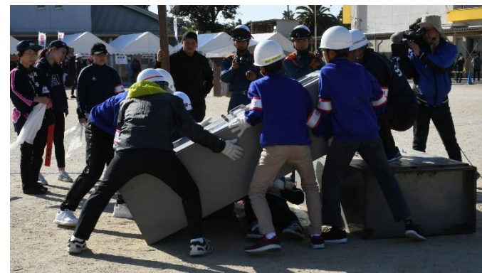
▲令和元年度の総合防災訓練の様子