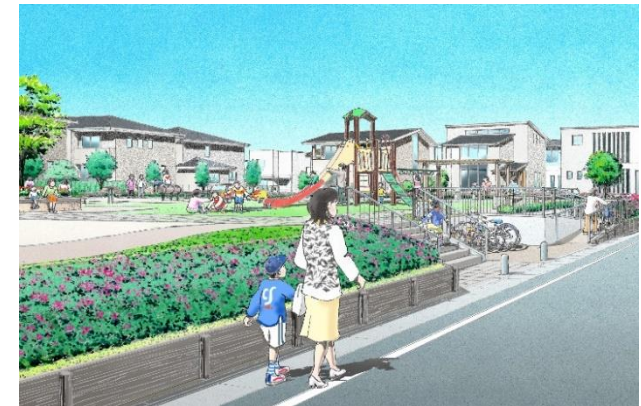
▲新市街地公園整備イメージ

誰もが安全、安心に利用できる公園にするため、計画的に公園の施設の更新等を行うとともに、新市街地整備に合わせて新たな公園の整備を行います。(292百万円)