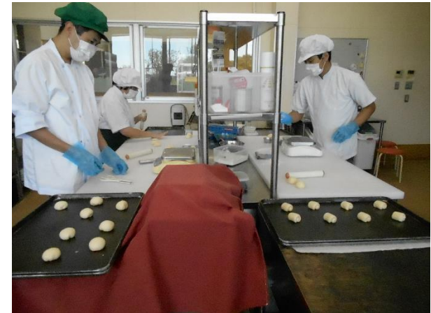
▲やまもも第2作業風景

特定健康診査による健康意識及び受診率の向上を図るため、 ナッジ理論を活用した一人一人に最適な受診勧奨 を行います。(16百万円)