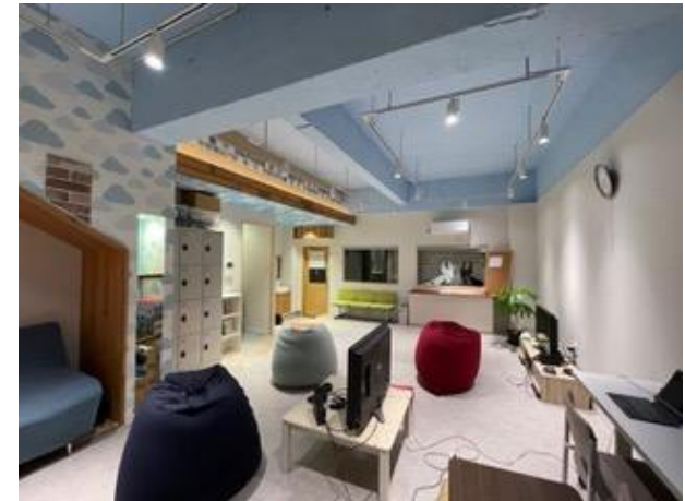
▲子どもたちへの居場所提供

0歳児から2歳児までの保育ニーズ等に対応するため、梅が丘幼稚園の認定こども園化に向けた施設整備を行います。(1200万円)