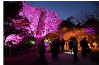
▲昨年度のライトアップの様子