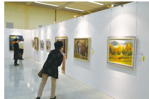
▲令和3年度市民美術展の様子

期 間 11月18日（金）～20日（日） 午前9時30分～午後5時（20日は午後4時まで）