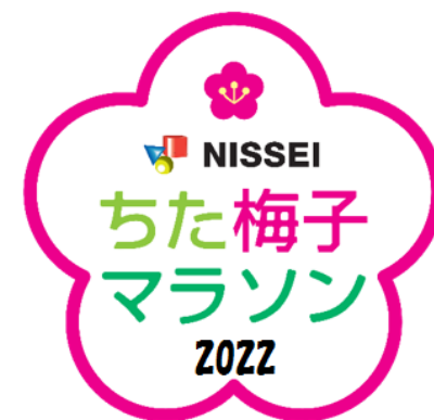
▲ちた梅子マラソンの大会ロゴマーク