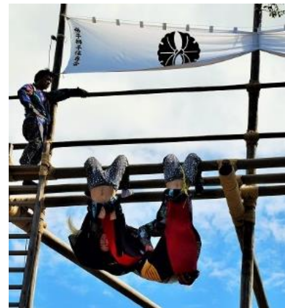
▲やぐらの上で披露される「大あおり」

新型コロナウイルス感染症対策を講じて実施し、感染状況によっては、入場規制の実施や内容の変更の可能性があります。また、朝倉の梯子獅子フォトコンテストを同時開催します。