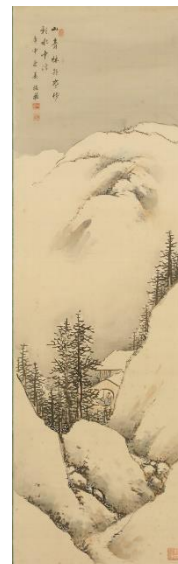
▲山本梅荘《淡彩四季山水》 1920（大正9）年

今回の展覧会では、六曲一双屏風、四季四幅対や松竹梅の掛軸20点程の作品を展示し、初めて展示する作品もあります。 山水図だけではなく、動物や植物が描かれた作品も展示予定です。