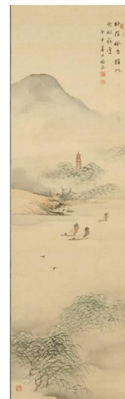
▲久野柳荘《紅葉山水》《桃林山水》 1967（昭和42）年