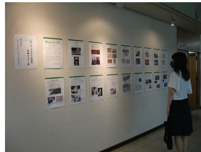
▲ヒロシマ・ナガサキ被爆の原爆ポスター展 (市役所)