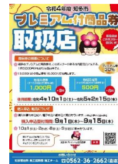
▲取扱店の目印 のぼり旗とポスター