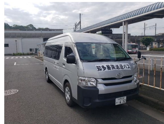
▲知多墓園送迎バス