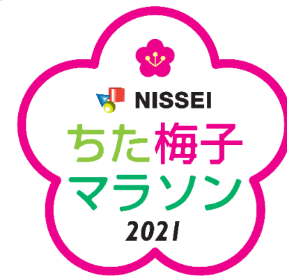
▲ちた梅子マラソンの大会ロゴマーク

多くの坂道が設定された走りがいのあるコースで、ゴール前には疲れを吹き飛ばす絶景をご覧ください。