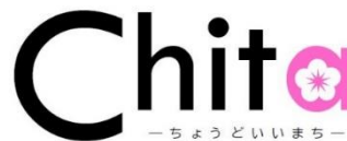
▲ 新しい広報のロゴデザイン

紙面のおよそ7割をカラー化（残りは二色刷）し、リニューアルを直観的に伝えるために、表紙のロゴデザインを変更します。