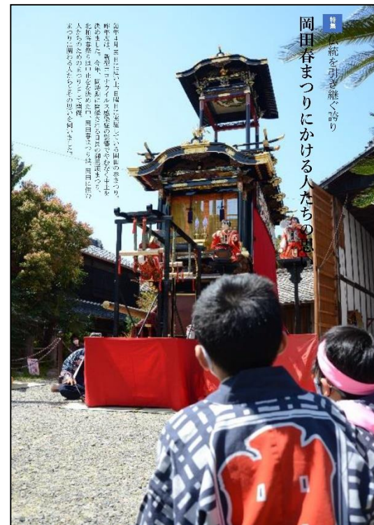
▲ リニューアル後の紙面(案)