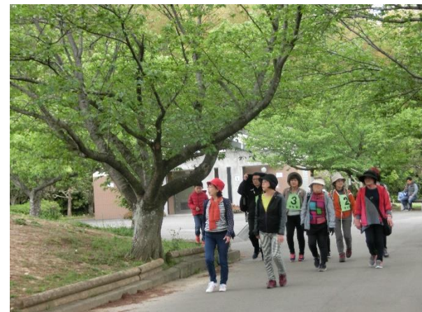
▲ウォーキングデーの様子

中継点には、輪投げ、グラウンドゴルフ、ストラックアウト（旭公園だけ）などのレクリエーション・スポーツが楽しめる体験コーナーがあります。