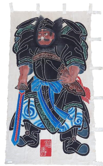
▲鐘馗 しょうき 幟 (昭和20年代)

金太郎コーナーでは、金太郎の物語の様々なシーンを表したかわいらしい人形を紹介합니다。