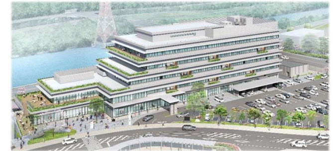
▲新庁舎のイメージ図

市内企業の魅力発信や市内での就職意欲の向上を図るため、企業セミナー「知多市DEはたらく」と職業体験イベント「チッタニア」を合同開催します。(2百万円)