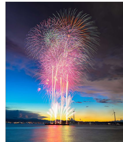
▲新舞子ビーチフェスティバル

交流人口の拡大を図るため、新舞子ビーチフェスティバルを継続開催します。(64百万円)