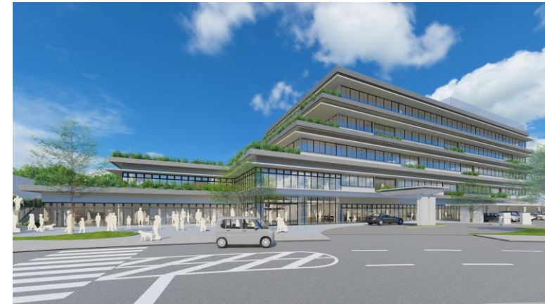
▲新庁舎のイメージ図

時代に即した墓地のニーズに対応するため、合葬式墓地の整備を行います。(134百万円)