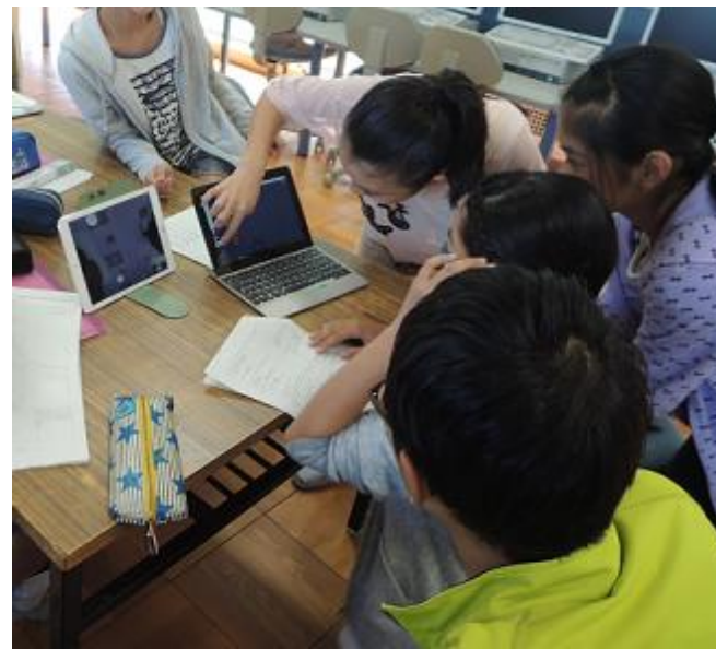
▲ タブレット端末を使用した授業の様子