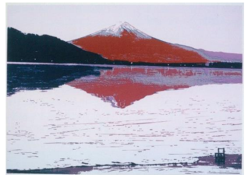
▲森岡完介《95-11 Fuji》1995年 個人蔵

12月1日(日)の午前11時からと午後2時から の2回、森岡完介氏によるギャラリートークを開催 します。各回1時間程度です。 申し込みは不要、参加は無料です。