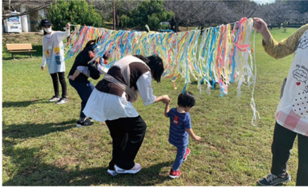
外遊び(運動会ごっこ)