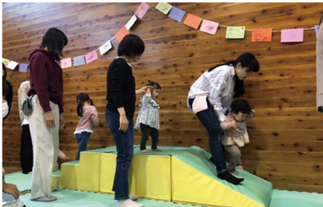
アップダウン遊び