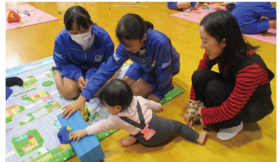
ふれあい体験の様子(中学校)

※利用時間については一部変更となる場合があります。児童センターにお問い合わせください。