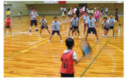
ドッジビー中央大会の様子