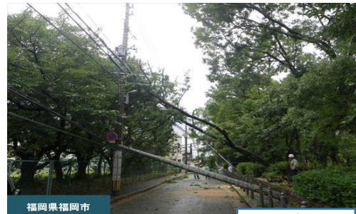
福岡県福岡市 災害による道路閉塞

中街区では、地震や台風などの災害時において、電柱の倒壊や電線の切断による道路の閉塞を防止するとともに、乗降客数の多い交通結節点において、安全かつ円滑な交通の確保を図るため、電線類（電気・通信線）を道路の地下にまとめて收容する無電柱化施設を整備します。