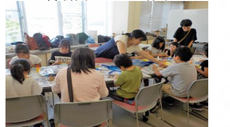
工作チームの様子

※waiwai 交流会とは、センター登録団体のみなさんが担当となり、年2回、地域の方や登録団体が楽しく交流する会です。