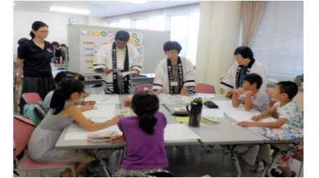
梅新聞チームの様子