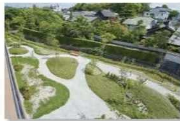
空地緑化（名古屋市）

市街地の民有地において、まとまった規模での優良な緑化工事費の一部を助成し、民有地緑化を推進します。