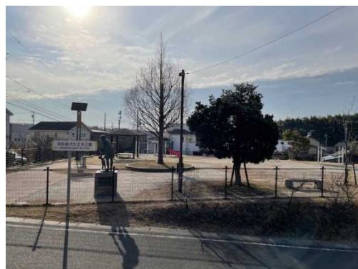
岡田緑が丘2号公園