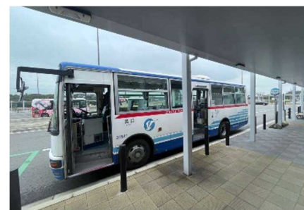
▲朝倉駅前バス停の様子