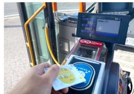
▲交通系ICカード決済の様子