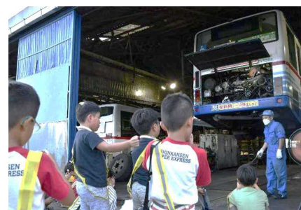
▲バス車庫ナイトツアーの様子（東浦町）