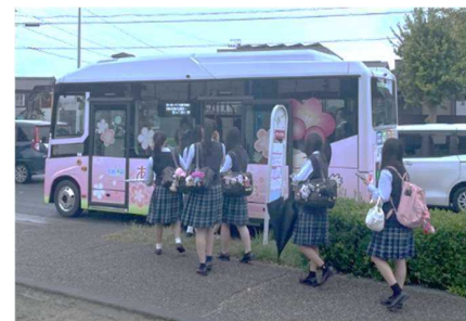
▲あいあいバス北部循環コース 寺本駅東バス停の様子