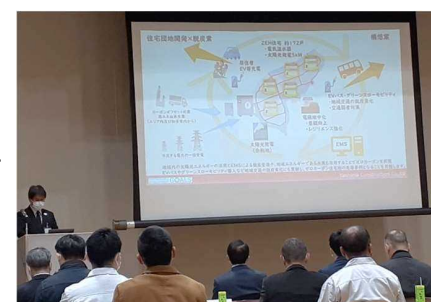
▲ゼロカーボンシティちた推進パートナー勉強会の様子