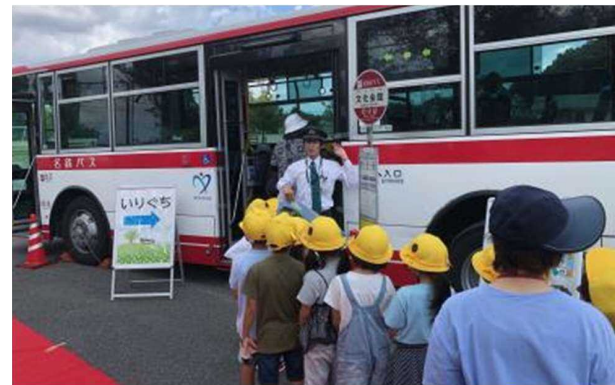
▲バスの乗り方教室・安全教室の様子（豊明市）