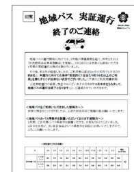
運行終了のお知らせチラシ（地区回覧）▲

⇒ 現在「地域バス実証運行に関するアンケート」の実施方法について、南粕谷コミュニティと調整中。