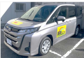
▲東部コミュニティ地域バス車両