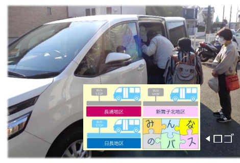
地域バスの車両のイメージ（旭北）↓