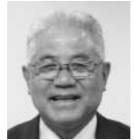
公明党議員団 泉 清 秀