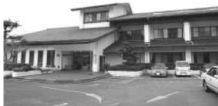
知多市老人福祉センター

答 閉館については、令和6年12月の市議会の全員協議会で報告し、7年4月号の広報ちたでお知らせを掲載しました。各施設では、閉館を周知するためのポスターを掲示し、チラシを配布しています。今後は、利用者を対象に説明会を開催するとともに、代替施設の提案などを行っていく予定です。利用者が育んできた人間関係や健康づくりの機会を継続できるよう、丁寧に対応していきます。