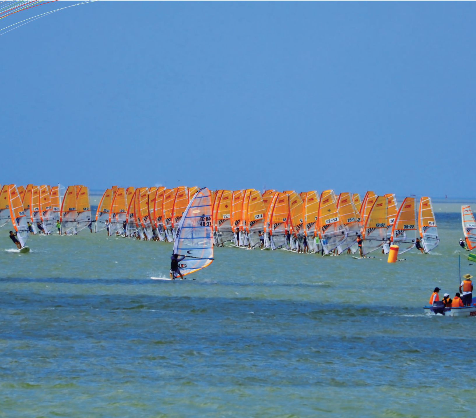
「ウィンドサーフィン競技」(新舞子マリンパーク)