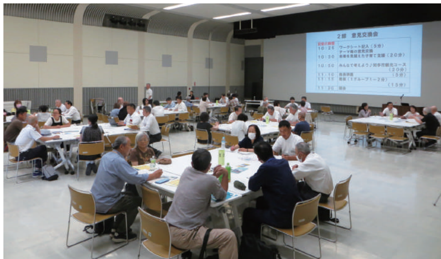
昨年度の議会報告会の様子