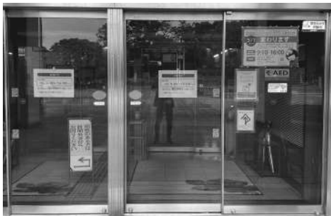
16時に閉庁した市役所正面玄関