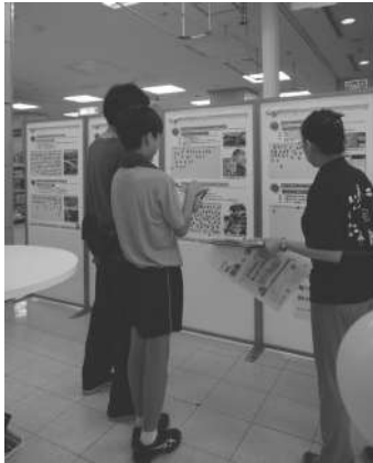
7/13(日) オープンハウスの様子

答 オープンハウスは7月13日にイトーヨーカドー知多店で実施し、買物に訪れた方が気軽に立ち寄れる展示スペースを設け、計画素案の概要をパネルで分かりやすく紹介しながら、アイデアや意見を自由に寄せていただける場とします。また、市民ワークショップは8月9日に市役所で開催し、市内在住・在勤の中学3年生以上の方を対象に、参加者を公募し、当日は大学教授によるミニ講演のほか、グループに分かれて公共交通について意見交換を行います。いただいた意見などは、計画の検討・改善に活かすとともに、今後の公共交通の取組の参考とします。