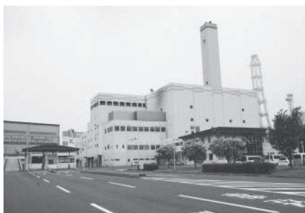
解体予定の旧清掃センター

答 近隣に住宅等がないため直接的な影響はないものと考えておりますが、隣接する西知多クリーンセンターの利用に影響のないよう、センター利用時間帯における工事車両の出入を調整するなど、西知多医療厚生組合及びセンターと打合せを行い、安全対策を徹底した上で工事を進めていきます。