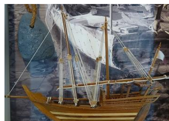
真珠採りをしたダウ船

右の船は今でもドーハ港でたくさん見られる船です。昔は真珠採りの船として活躍したダウ船です。今では観光用として乗船でき、ドーハ港を遊覧することができます。