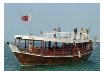
観光用に改造したダウ船