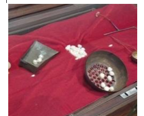
真珠の大きさを量る道具