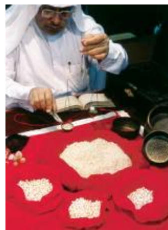
真珠の重さを量る真珠商人

養殖の真珠が世界に出回るようになってから、カタールでは真珠採りをする人が減り、今では、ほとんどなくなってしまいました。