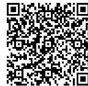
▲LINE 予約用 QR コード

LINEで予約する場合は、右のQRコードを読み取り お友だち登録をして申請してください。