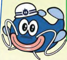
あいち防災キャラクター 防災ナマズン