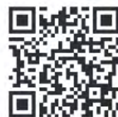
あいち・なごや強靱化共創センター