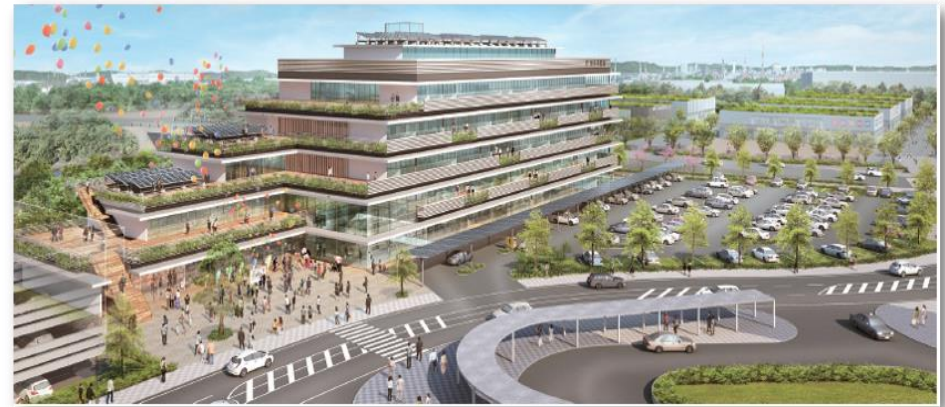
▲新庁舎のイメージ図

誰もが安全、安心して利用できる公園にするため、計画的に 公園の施設の更新等 を行うとともに、 新市街地整備に合わせて新たな公園の整備 を行います。(431百万円)