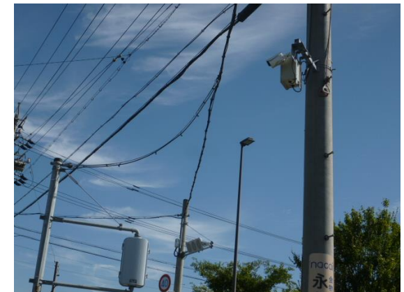
▲防犯カメラの設置