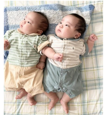
▲多胎児家庭支援イメージ