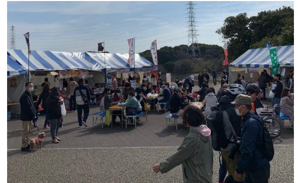
▲ 昨年度の佐布里池梅まつりの様子