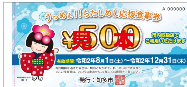
▲食事券の見本品 500円券が10枚つづり