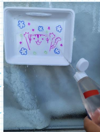
的はトレイに絵を描くだけ！

材料：ペットボトルやケチャップ容器 油性ペン、耐水シールやビニールテープ、プラスチックトレイなど