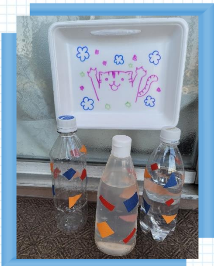
ケチャップ容器は柔らかくて水遊びにおすすめ！

空き容器を使って、水鉄砲やジョウロみたいに遊べるよ！ ペットボトル：キャップに穴を数か所開けると水鉄砲に、 底のほうに穴を開ければジョウロになるよ！ 耐水シールやビニールテープで飾り付けてみてね。