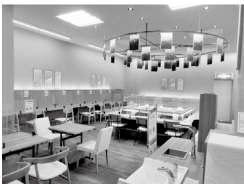
期日前投票所を設置する予定の イトインコーナー (イトーヨーカドー知多店)

また、投票日当日における投票所の混雑緩和のため期日前投票の一層の利用促進を図り、投票機会の分散化を図ります。期日前投票所は、従来の市役所に加え、イトーヨーカドー知多店1階の北側エレベーター横にあるイトインコーナーへの設置を予定しています。