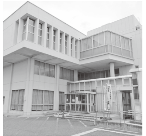
旭まちづくりセンター

答 災害時の避難所における通信環境整備のため、東部・岡田・旭の各まちづくりセンターに、無線LANを整備するものです。東部まちづくりセンター本館の1階・2階、岡田まちづくりセンターの1階・2階、旭まちづくりセンターの1階から3階までの、計7か所にアクセスポイントを設置します。