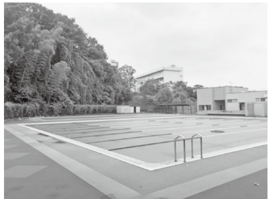
八幡中学校のプール

答 小学校のプールは、老朽化のため順次廃止する計画であり、令和6年度以降は水泳の授業を健康増進施設で行います。また、中学校のプールは、幼児や児童にとっては水深が深いこともあり、開放