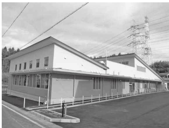
子育て総合支援センター

今後は、把握したヤングケアラーの情報を市で取りまとめ、関係機関と調整・連携し、適切な支援につなげる早急な体制整備に努めます。