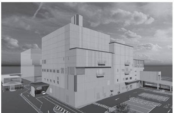
西知多クリーンセンター完成予想図

答 今回の変更により、ごみ処理施設の建設完了後における建設費の支弁方法が、人口割から搬入量割に改められます。人口割の場合、本市の比率は42・5%（令和5年度実績）です。一方、搬入量割の場合、3年度におけるごみ総排出量の実績から算出した本市の比率は40・4%で、約2ポイントの差があります。