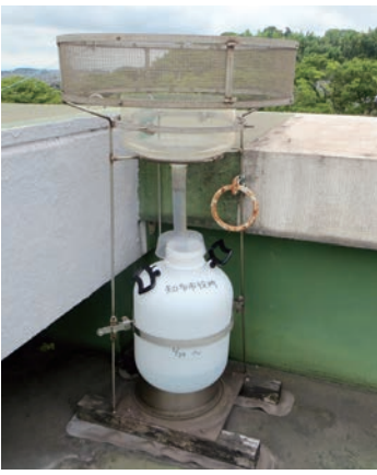
庁舎の屋上にある 降下ばいじん測定器

答 降下ばいじんについては、市内3か所の調査地点で測定しています。その総量は昭和40年代と比較すると大幅に改善されていますが、その発生源は、黄砂などの自然由来のものなど、様々な要因が考えられます。