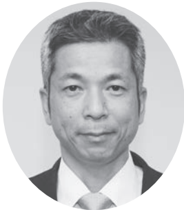
5 小 浦 智 夫 つつじが丘 49歳 公明党議員団