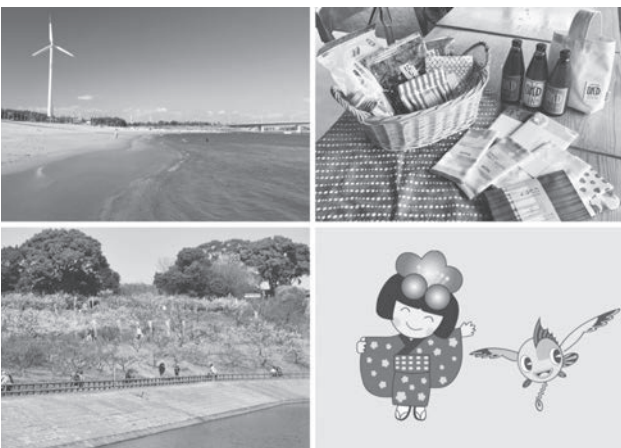
知多市の観光資源

答 現行の計画は、令和5年度で終期を迎えます。その中で掲げている観光入込客数などの数値目標は、計画の着実な推進を図った結果、今年度末には全て達成できる見込みです。新たな計画は、地域における観光客1人当たりの消費単価を拡大し、地域が稼ぐ力を身につけることに焦点を当てて策定します。具体的には、既存サービスの高付加価値化のほか、既存の資源を活用したワンランク上の観光コンテンツの造成を実現するため、観光資源調査などの分析結果に基づき、アクションプランの策定を進めます。