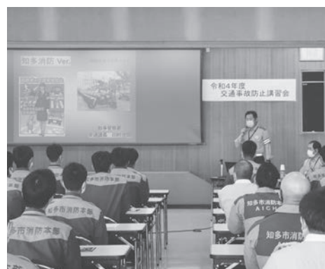
交通事故防止講習会の様子

定めています。緊急自動車の運行中に事故が発生した場合は、この要綱の基準に従い対応します。