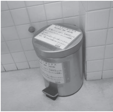
庁舎内のサニタリーボックス

答 市庁舎には、多様性に配慮した施設・設備が求められています。その一環として、病気や高齢のためサニタリーボックスを必要とされる方々にも安心して来庁していただけるよう配慮した対応を行っています。現状は、窓口利用を中心に来庁者の多い新館1階にある2か所のバリーフリートイレに、令和4年11月からサニタリーボックスを設置しており、男性も利用していただくことができます。現庁舎での増設の予定はありませんが、新庁舎への設置については、今後の検討課題です。