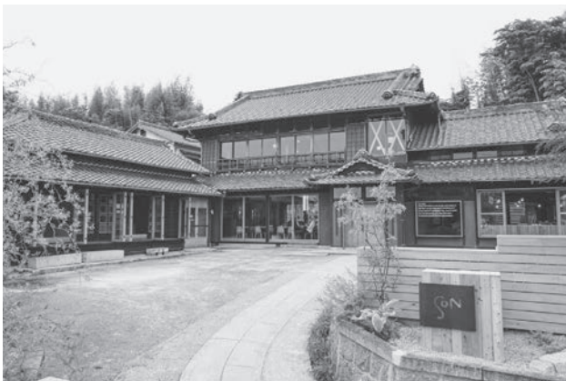
岡田にある古民家を活用したカフェ

この構想では、地区特有の資源を経済活動に結び付けることがポイントです。古民家等の付加価値を高め、収益と雇用を生むことで、地域全体への波及効果も期待されます。住民にも来訪者にも魅力の高いまちづくりに向け、地域内で保存と活用の好循環が生まれるよう、市としても継続して関わり、支援していきます。