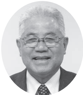
13 いずみ きよ ひで 泉 清 秀 岡田 65歳 公明党議員団