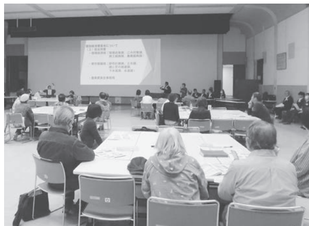
議会報告会の様子