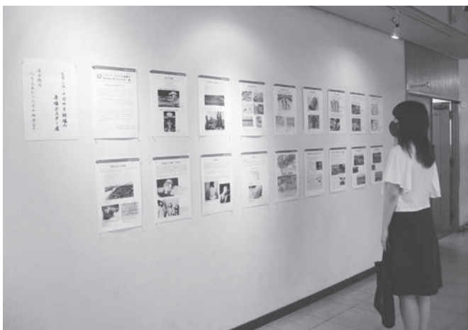
原爆ポスター展の様子

答 第6次総合計画では、自然災害に強く、治安がよい、安全で安心できるまちを理想のまちの未来として位置付け、まちづくりを進めています。これは、平和な社会の実現なくしてはあり得ないものと考えています。また、平和に関する市民啓発と意識の喚起のため、現在の原爆ポスター展などの取組を実施するとともに、市公式ラインとX（旧ツイッター）を活用した啓発を継続していきます。