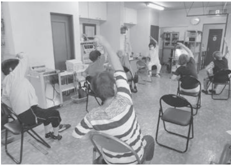
まちかど体操クラブの様子

例として、高齢者の体操教室「まちかど体操クラブ」や健康づくりについて学ぶ「わくわく健康アップ講座」などを開催し、啓発に努めています。また、介護予防の取組を行っているサロンなどの運営団体に継続的な支援を行うとともに、高齢者雇用の取組として65歳以上の会計年度任用職員を146人任用しています。