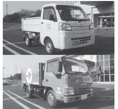
戸別収集車両 軽トラック(上) 2トントラック(下)