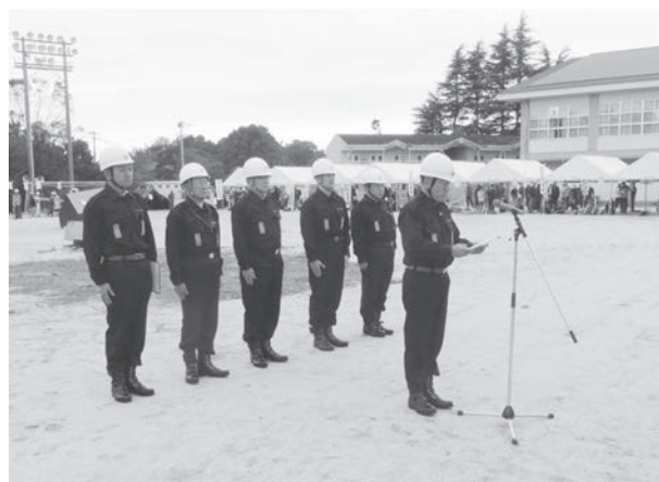
市災害対策本部長への報告