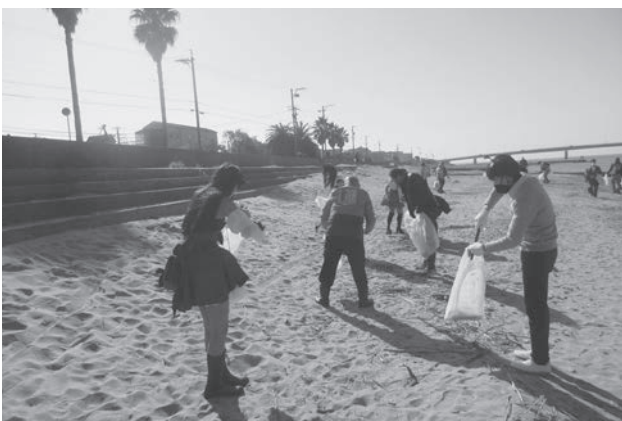
コスプレde海ごみゼロ解放区 at新舞子マリンパークの様子

今後も啓発活動やボランティア清掃活動への支援を継続し、引き続き環境美化意識の向上、ポイ捨てされない清潔なまちづくりを推進します。