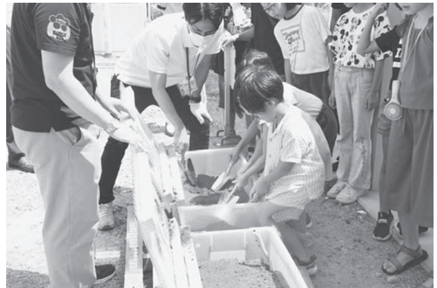
ごみの減量と資源化を学ぶ親子講座での キエーロ掘削体験の様子

答 指定ごみ袋については、プラスチック類の一括回収の開始などにより、容量の小さいものへの需要が高まると考えられるため、現行の20リットルより小さいサイズの追加を検討します。生ごみの減量については、市民が自ら取り組むことができるよう、キエーロ（黒土中のバクテリアが生ごみを分解する生ごみ処理器）の普及啓発に取り組みます。刈り草の処理については、堆肥化を進めることで、ごみ