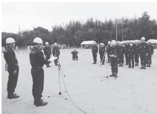
市議会本部員参集時の様子

11月12日、八幡中学校において議会防災訓練を実施しました。この訓練は、大規模地震及び台風の接近に伴う各種被害を想定して行われた知多市総合防災訓練にあわせて、大規模災害発生時における議会としての円滑な活動に資することを目的として実施したものです。