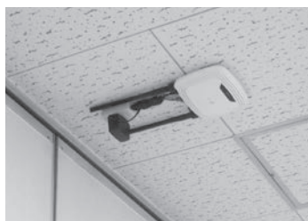
福祉活動センターのWi-Fi設備

現在の指定管理者は、法人の独自財源や各種助成金を活用し、貸会議室におけるWi-Fi対応や、ボランティアなどの備品整備を行っています。こうした施設機能の充実に加え、利用者からのボランティア活動に関する相談にも職員が丁寧に対応しており、本市の地域福祉活動の充実、強化につながっています。