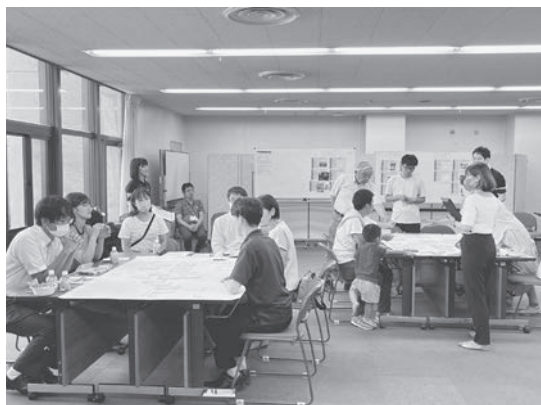
市民ワークショップの様子

開催しました。いただいたご意見は、屋外の広場などの広場機能の拡充や、屋内の市民交流スペースへのカウンター席の設置などといった形で設計に反映します。また、今後、基本設計案に対するパブリックコメントを実施し、ワークショップでは捉えきれなかった意見などをいただきたいと考えています。その後、令和6年3月に基本設計を公表し、9月に実施設計を策定、7年4月に建設工事に着手し、9年5月の開庁を予定しています。