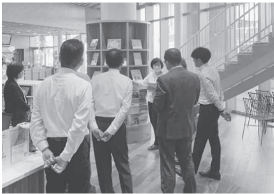
焼津市での視察の様子