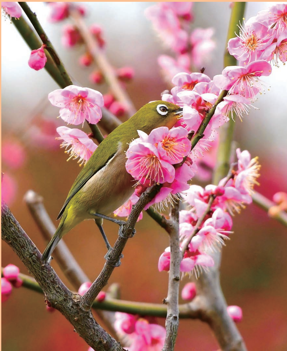
「紅梅に蜜を求めて」