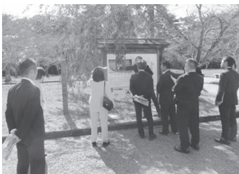
白石市での視察の様子

観光振興による経済効果だけでなく、地元への愛着や誇りにつながる取組でもあり、本市においても活用していきたい内容であった。