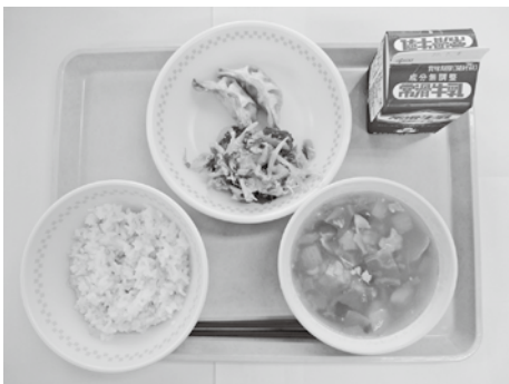
学校給食のメニューの一例

答 これまでに、献立や使用食材の工夫などをしてきましたが、相次ぐ食材の高騰により、学校給食の栄養バランスと量を維持することが困難になりつつあります。そこで、給食費の値上げをせず、賄材料費を増額することで対応します。