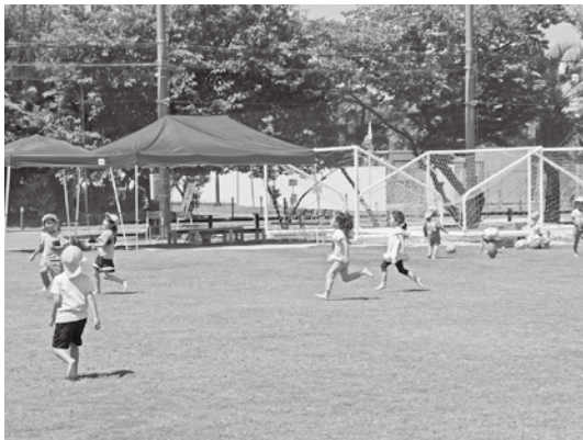
天然芝グラウンドを活用した遊び体験の様子

です。学習活動時については、屋内では、身体的距離の確保ができない中で、発言などが行われる場合はマスクの着用が必要で、屋外では、呼吸が激しくなる体育の授業などではマスクの着用は必要ないとしています。今後とも子どもたちの安全安心を最優先に考え、熱中症対策を優先しながら感染症防止対策を徹底していきます。