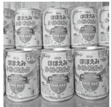
備蓄している液体ミルク

栄養機能食品や保存用野菜飲料といった栄養食の備蓄は、消費期限や保管場所などの問題もあり、今後の検討課題と考